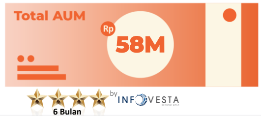
*Data per 29 May 2026