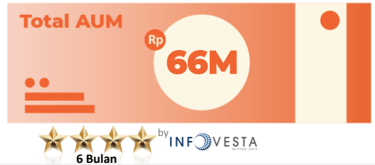
*Data per 30 April 2026